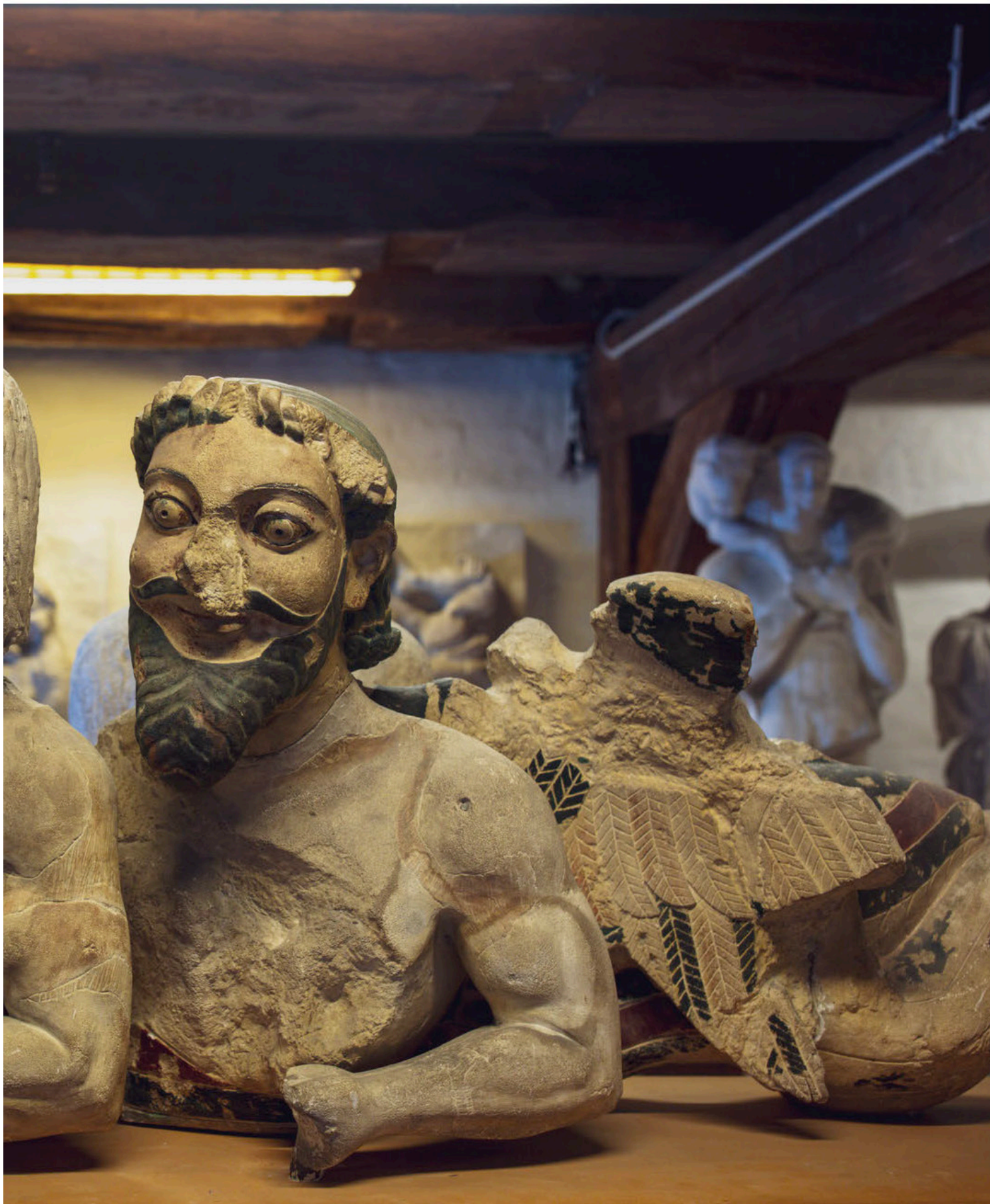
TYPHON. Kopi af skulpturgruppen, et uhyre med tredobbelt mandsoverkroppe, fra Athenatempelet på Akropolis i Athen. Originalen er lavet 570-550 f.v.t., kopien er lavet i 1906 af billedhugger Anne Marie Carl-Nielsen. Hun tog til Akropolis og lavede en lerkopi af den oprindelige figur. Ud fra den lavede hun en afstøbningsskulptur, som kunne bruges til at skabe gipskopien.