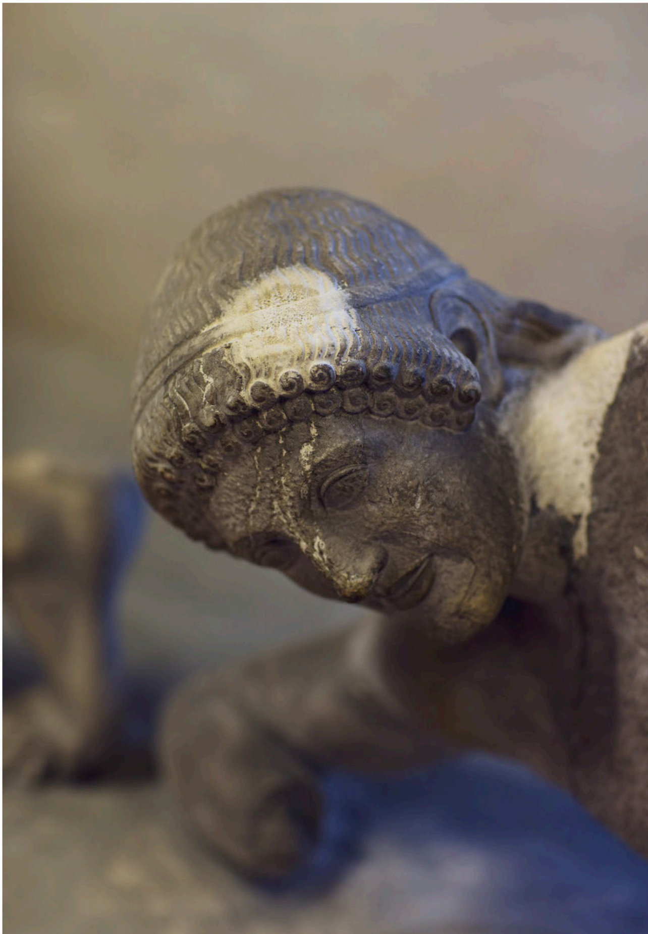
SKADET. Billedhuggeren Bertel Thorvaldsens rekonstruktion af 'Liggende, såret kriger' fra Aphaia-templets vestgavl, i Ægina i Grækenland har taget skade af de vanddråber, der gennem formentlig en uge, dryppede ned på figuren, før skaden blev opdaget.